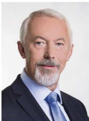
Krzysztof Hildebrandt, prezydent Wejherowa

Kadencja 2010-2014 była rekordowa pod względem przeprowadzonych w Wejherowie inwestycji. Ogółem na inwestycje wydaliśmy kwotę 92,2 mln zł! To są konkretne liczby, które obrazują niespotykany w historii miasta rozwój w tak krótkim czasie. Zdobyliśmy 26,7 mln zł dotacji unijnych. Inwestycje realizowane za te pieniądze służą mieszkańcom Wejherowa.