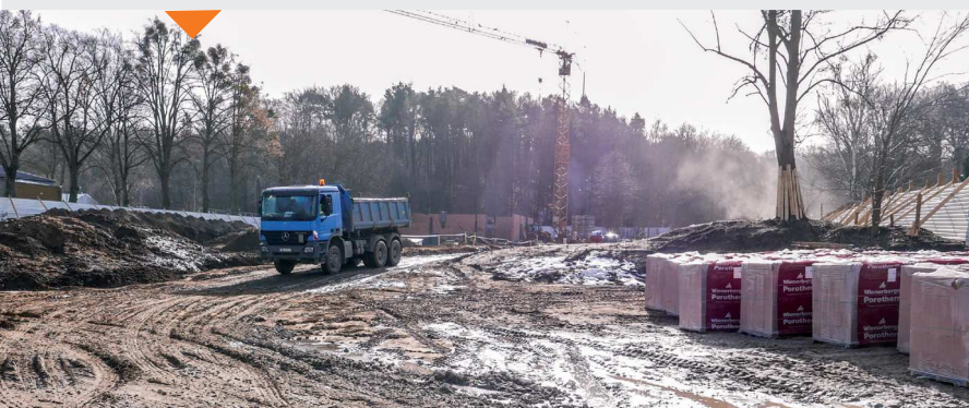
Pracowita sesja Rady Miasta