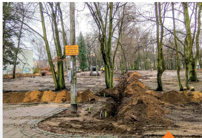
Rewitalizacja Parku Kaszubskiego