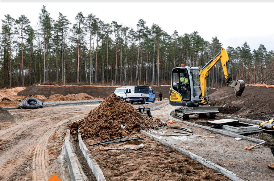
Budowa połączenia Strzelecka-Sucharskiego Budowa „Wodnych Ogrodów”