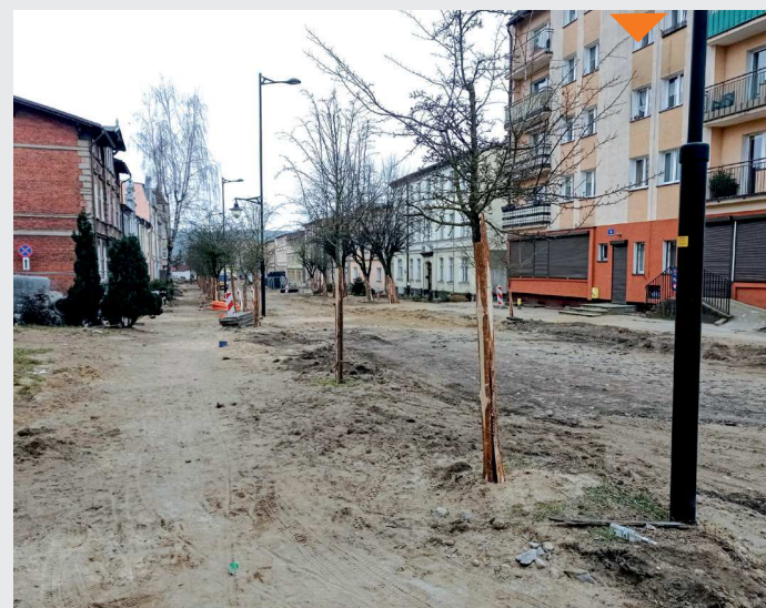
Nowoczesny system zbiórki i segregacji odpadów w Wejherowie