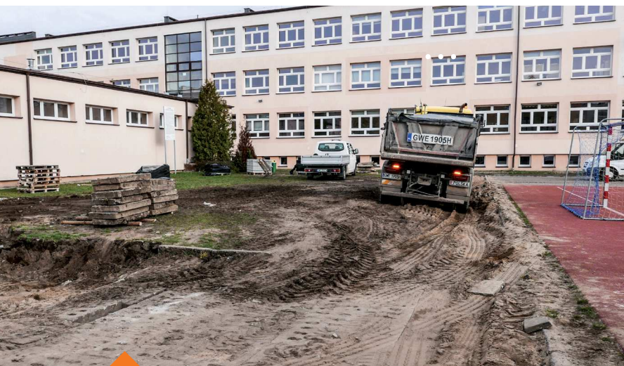
Budowa boiska przy SP 11